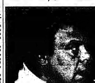
وحيد سيف الكوميديا

بعد انسحابه من برنامج «قسطه وعسل» على قناة الكوميديا، يعلن الفنان الكوميدي ووحيد سيف عن مشاريعه المستقبلية. سيشارك في برنامج جديد، مما يثبت مكانته كواحد من الفنانين الكوميديين البارزين في المنطقة. ووحيد سيف هو من الفنانين الكوميديين الفلسطينيين، وقد شارك في العديد من البرامج الكوميدية، مثل «قسطه وعسل».